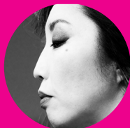
YURIKO MIKAMI — CELLIST —